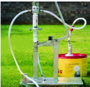
Ffigur 3 Dylech ddefnyddio system drosglwyddo gaeëdig (CTS) ar gyfer trochdrwythi Organoffosfforaidd