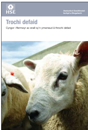
Mae hwn yn fersiwn gwe-gyfeillgar o daflen AS29(rev3), a adolygwyd 07/07

Cyngor i ffermwyr ac eraill sy'n ymwneud â throchi defaid