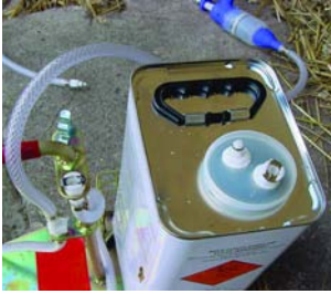
Ffigur 5 Cit CIS