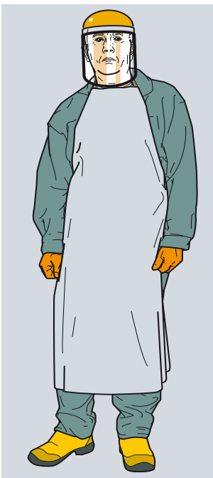
Ffigur 2 Mae'n rhaid i weithredwyr wisgo PPE addas