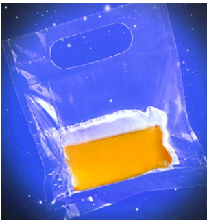
Ffigur 4 Enghraifft o becyn â chynhwysion sy'n toddi mewn dŵr